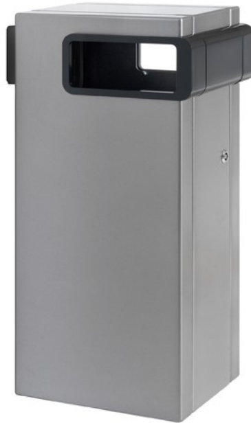
Bildet viser NOBEL 50L i standard farger