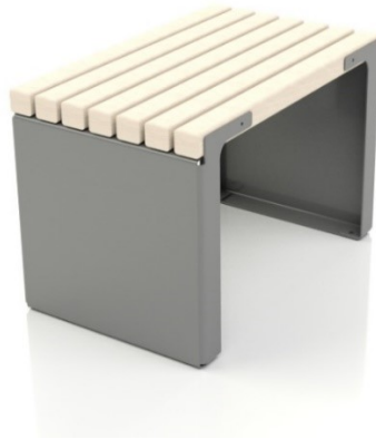
Bildet viser NOBEL krakk i rustfritt stål og malmfuru