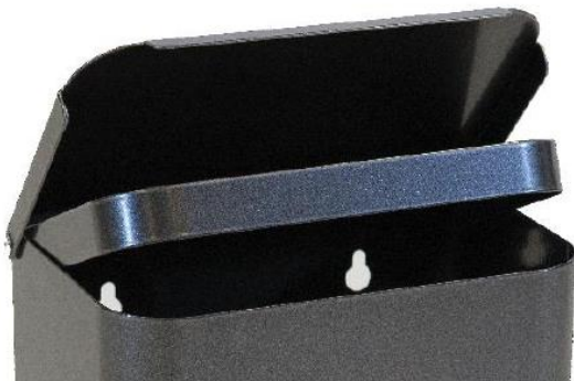
Innvendig poseholder og lokk